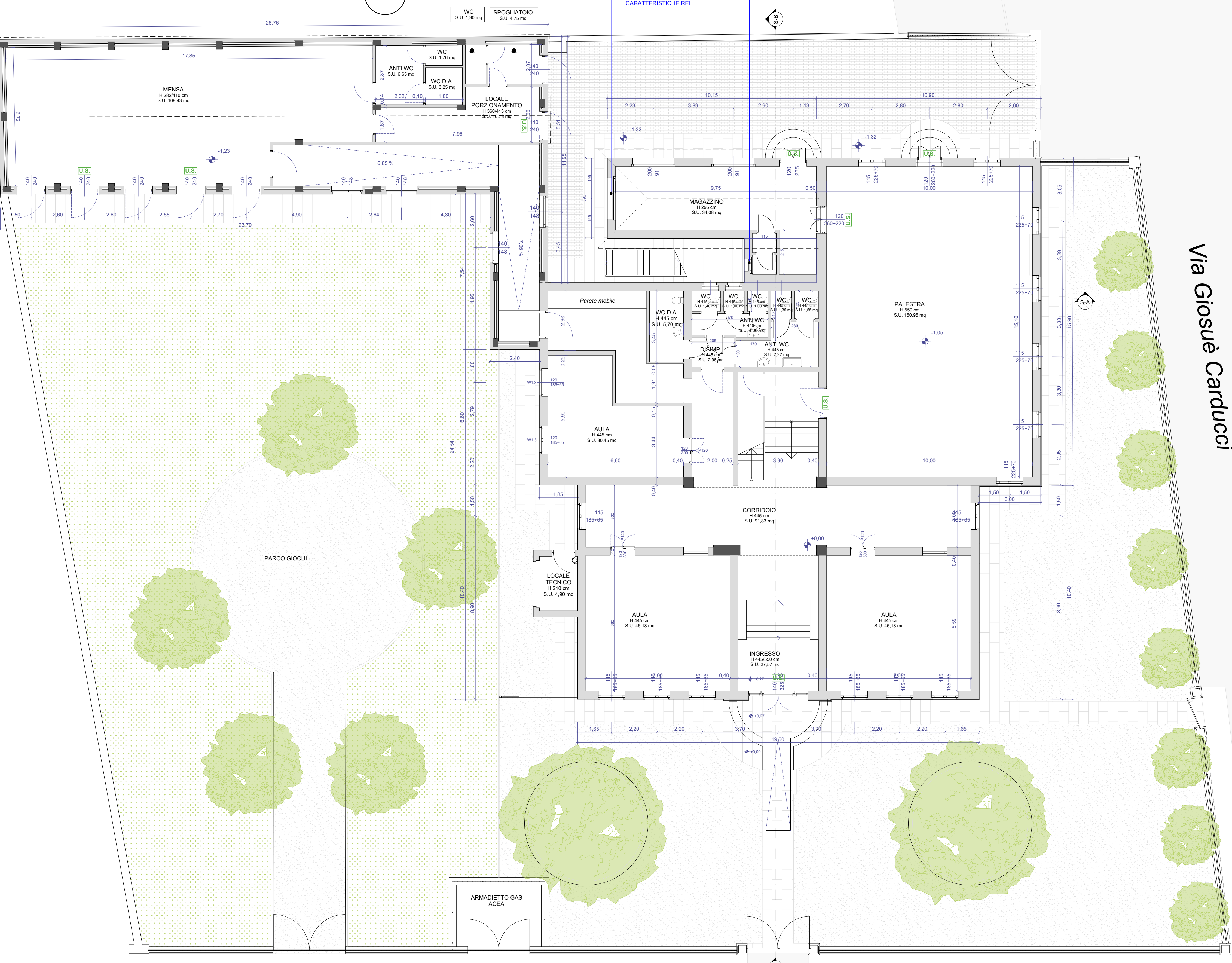
Pianta Piano Terra - Stato di Fatto scala 1:100